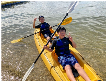
《1日目》シーカヤック体験