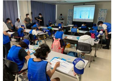
《1日目》愛知丸の復習