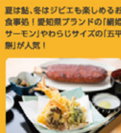
天ぶら五平餅膳 1,200円