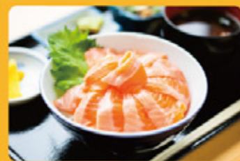
絹姫サーモン丼 1,400円