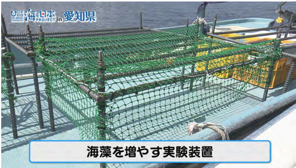
海藻を増やす実験装置

そしてごみを取り除いた後は海藻を人工的に増やす実証実験を三河湾で初めて行いました。