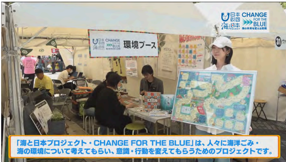
「海と日本プロジェクト・CHANGE FOR THE BLUE」は、人々に海洋ごみ・海の環境について考えてもらい、意識・行動を変えてもらうためのプロジェクトです。

世界初！複数の無人運航船を陸上から同時に支援 | 日本財団「MEGURI2040」が加速させる海運DXと社会実装の最前線