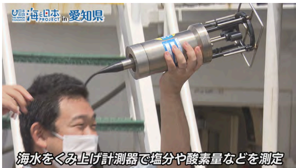
海水をくみ上げ計測器で塩分や酸素量などを測定

10キロほどの沖合で海洋調査開始。海水をくみあげ、計測器で塩分や酸素量などを測定します。