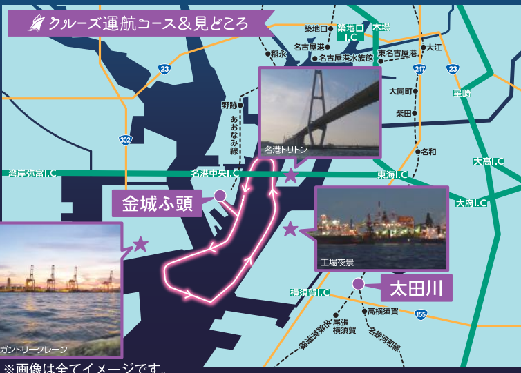
※画像は全てイメージです。