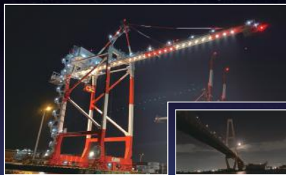
ガントリークレーン 名港トリトン