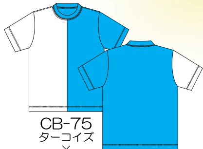
CB-75 ターコイズ × ホワイト