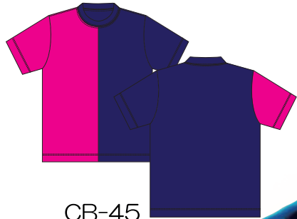
CB-45 ネイビー × ショッキングピンク