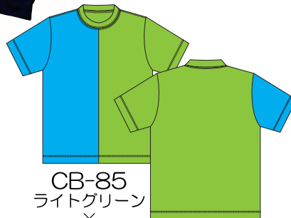
CB-85 ライトグリーン × ターコイズ