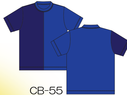
CB-55 ロイヤルブルー × ネイビー